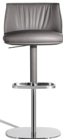
VISION Post 1

该款表达材质的形式轻盈与感官魅力：散边加工彰显皮革和软皮触感，搭配之后互相彰显价值；靠背上的轻盈缝线描绘出微笑的形状。