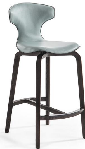
VISION Post 3