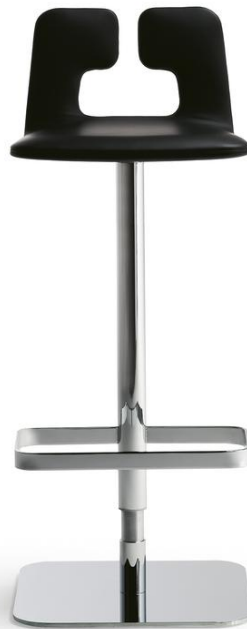
VISION Post 2