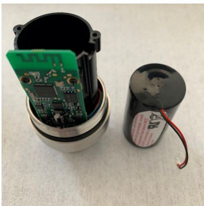
拆下的所有零件如图：